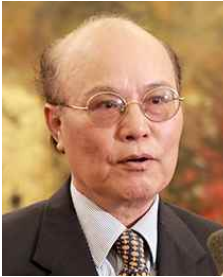
르 반 방 LE Van Bang

전 주미국베트남대사 Former Ambassador of Vietnam to the United States