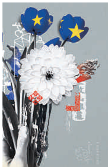
Entente UE-Taiwán — p. 72