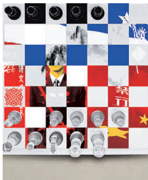
EE.UU. ¿qué grado de compromiso? — p. 56