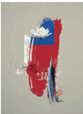
Ilustraciones de SR. GARCÍA