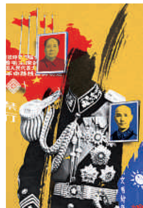
Tensa cercanía — p. 36