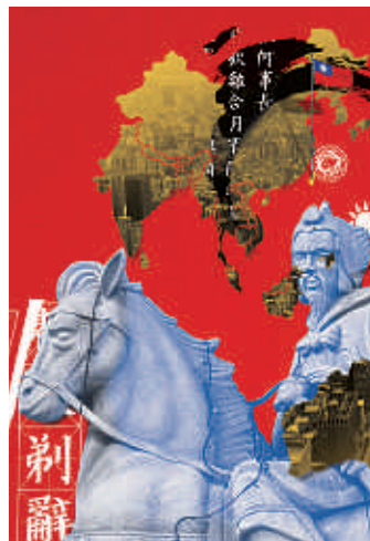
Un país eje de equilibrio — p. 16

FEDE ERRATAS: En el número anterior (n.º 86, Desorden mundial ) faltaba la primera página del artículo "Oriente Medio: ¿amigos y enemigos para siempre", de Eduard Soler i Lecha que sí figura en la edición digital. El lector o subscriptor puede solicitar el pdf del artículo completo al e-mail: suscripciones@lavanguardia.es