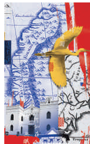
Isla Hermosa — p. 76